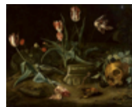
Rachel Ruysch « Vanité »

Faire écouter le film sans montrer les images.