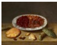
Jacob van Hulsdonck, « Nature Morte »